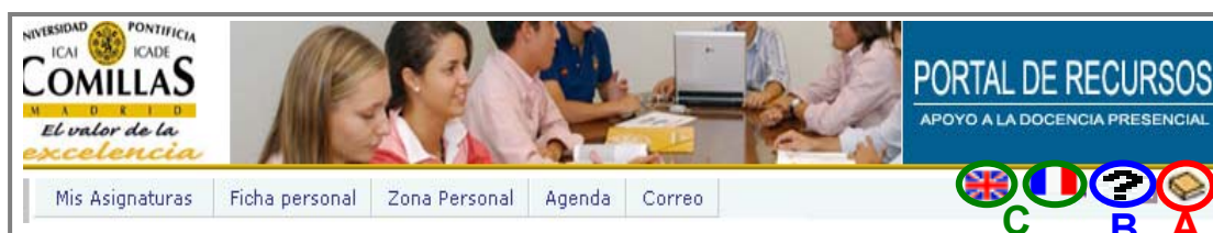
Figura 3: acceso desde el Portal de Recursos