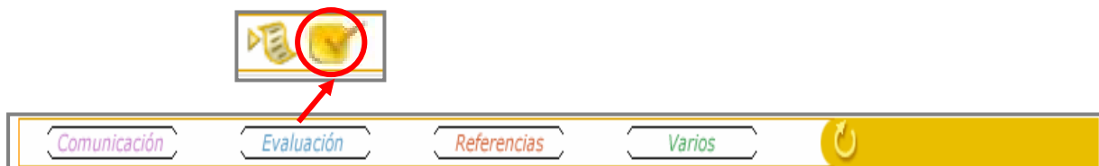
Figura 1: acceso a las calificaciones

Para acceder a las calificaciones se deberá hacer clic en EVALUACIÓN, para seleccionar posteriormente el segundo icono, tal y como aparece en la Figura 1.