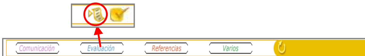
Figura 1: acceso a Ejercicios

Para acceder a la lista de ejercicios se deberá hacer clic en EVALUACIÓN, para seleccionar posteriormente el primer icono que tiene forma de papel, tal y como aparece en la Figura 1.