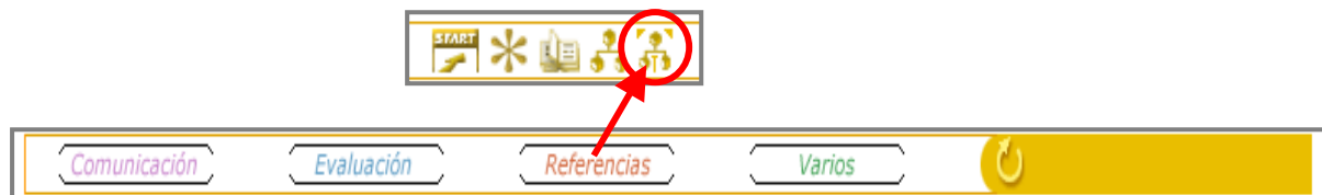
Figura 1: acceso a la Zona común al curso

Para acceder a la Zona común al curso se deberá hacer clic en REFERENCIAS para seleccionar posteriormente el quinto icono, tal y como aparece en la Figura 1.