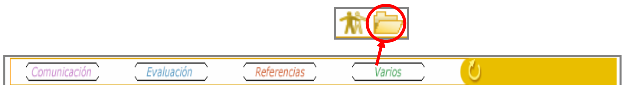
Figura 1: acceso al Directorio

Para acceder a esta opción se deberá hacer clic en la herramienta de VARIOS (A) y posteriormente hacer clic en el icono de DIRECTORIO (B), tal y como se observa en la Figura 1.