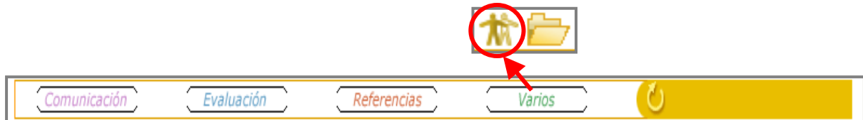
Figura 1: acceso a los encuentros presenciales

Para acceder a los encuentros presenciales se deberá hacer clic en VARIOS, para seleccionar posteriormente el primer icono, tal y como aparece en la Figura 1.