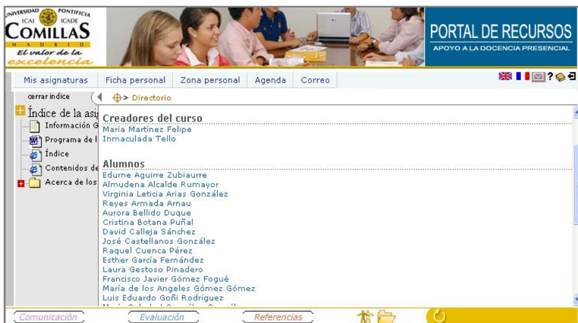
Figura 2: Directorio

Una vez que se ha accedido al Directorio, bastará con hacer clic en el nombre de la persona (Figura 2) para visualizar su FICHA PERSONAL.